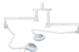
Двокупольний, СТЕЛЬОВЕ КРІПЛЕННЯ SATSONX2-LED