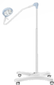
Однокупольний, СТЕЛЬОВЕ КРІПЛЕННЯ SATPIN-LED