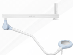
Однокупольний, СТЕЛЬОВЕ КРІПЛЕННЯ SATSON-LED

Цей світильник хірургічного типу підходить для малих неінвазивних операцій, для гінекології та для відділення невідкладної допомоги. Той факт, що промені розташовані близько один до одного (розмір рефлектора 195 мм), означає, що їх не потрібно фокусувати. Світильник дуже легко переміщати завдяки легкості алюмінієвої опорної конструкції.