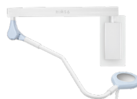
Однокупольний, НАСТІННЕ КРІПЛЕННЯ SATPAN-LED