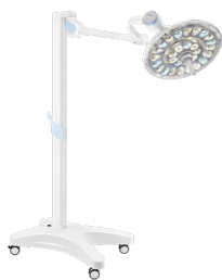
ОДНОКУПОЛЬНИЙ, МОБІЛЬНА ВЕРСІЯ U29PI