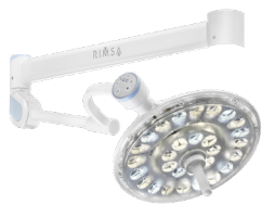
ОДНОКУПОЛЬНИЙ, СТЕЛЬОВЕ КРІПЛЕННЯ U29SO