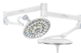
ДВОКУПОЛЬНИЙ, СТЕЛЬОВЕ КРІПЛЕННЯ U29+29