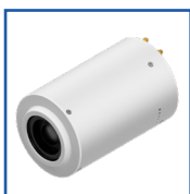
Камера: FULL-HD кабель FULL-HD Wi-Fi 4K кабель 4K Wi-Fi