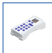
ІЧ (IR) пульт дистанційного керування