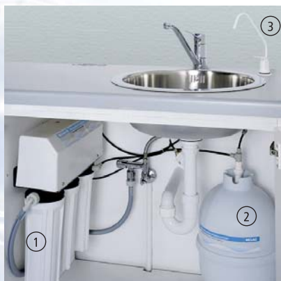
MELAdem®47 (1) в шкафчике в комплекте с накопительным баком (2) и краном (3)