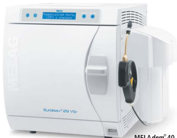
MELAdem® 40 установленный на автоклаве Euroklav® 29 VS+

Обслуживание автоклавов должно быть приятным и безопасным. Дизайн полностью соответствует этим требованиям. Он не только внешне привлекателен, но и рационален. Например, большой дверной запор не просто элемент дизайна, но и обеспечивает лёгкое и безопасное открывание и закрывание двери.