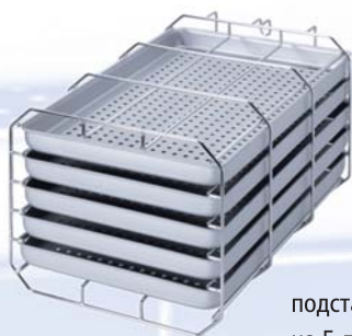
подставка типа А на 5 лотков

Автоклавы всегда поставляются с подставкой для лотков или кассет, включённой в стоимость. Обычно это подставка типа «А» (для 5 лотков или 3 стандартных кассет). Подставка для упакованных инструментов делает возможным вертикальную стерилизацию упакованных предметов для оптимальных результатов сушки.