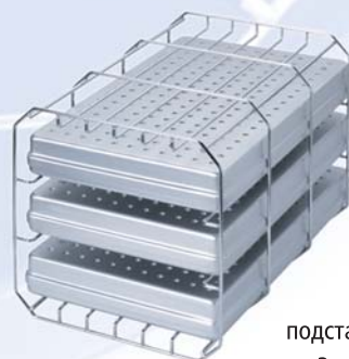
подставка типа А (повёрнутая на 90град.) на 3 стандартные кассеты