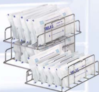
подставка для упакованных инструментов