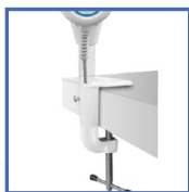
S11 Кріплення до столу