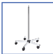
RLBI Мобільна основа