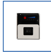
KITB24RL Акумуляторна батарея