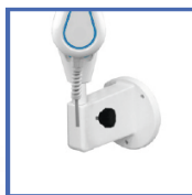
S12MED Настінне кріплення