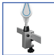
Z400819 Кріплення на рейку